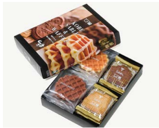
ワッフル&サブレ ¥1,350 (税込 ¥1,458)

箱サイズ: W107 × H95 × D125mm ※熨斗 (のし) 対応/不可