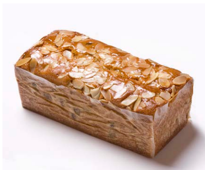
ハンドメイドバターケーキ (大) [フルーツ]