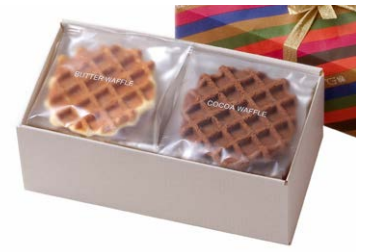
G線職人手焼きワッフル [10枚入り]

バター、ココア、ココナッツ 各3枚 箱サイズ: W310 × H50 × D110mm