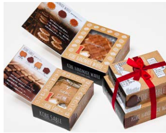
ワッフル&サブレ ¥1,100 (税込 ¥1,188)

サブレ4枚 (バター、ココア、ココナッツ、黒ごまココア各1枚) ワッフル3枚 (バター、ココア、ココナッツ 各1枚)