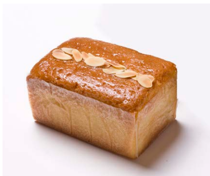
ハンドメイドバターケーキ (小) [アーモンド]