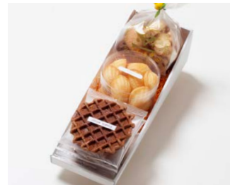
G3-Bセット ¥2,800 (税込 ¥3,024)

ワッフル5枚 (バター3枚、ココア2枚) プチマドレーヌ (バター) 120g アソートクッキー 130g