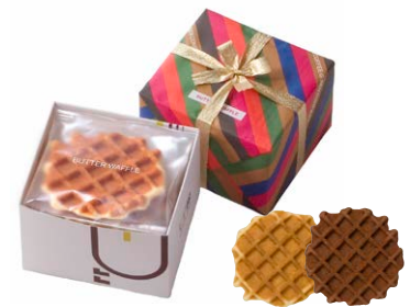
G線職人手焼きワッフル [ペアセット/4枚入り]

バター 2枚、ココア 1枚 箱サイズ: W135 × H220 × D45mm ※熨斗(のし) 対応/不可