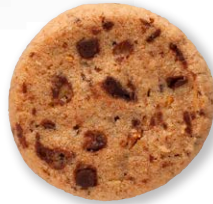
ベネチア スイス産バナラチョコチップを ふんだんに使用した アーモンドクッキーです