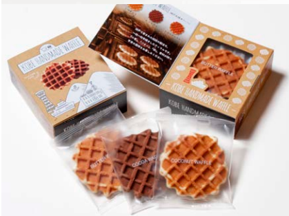
G線職人手焼きワッフル [ペアセット/3枚入り]