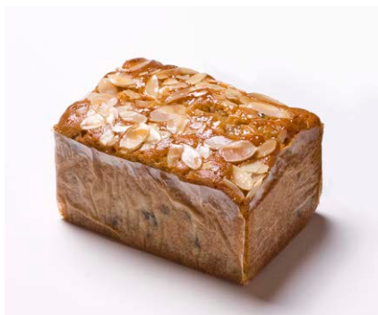
ハンドメイドバターケーキ (小) [フルーツ]