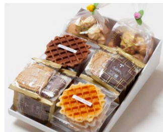
G6-Bセット ¥5,600 (税込 ¥6,048)

サブレ20枚 (バター、ココア各6枚、ココナッツ、黒ごまココア各4枚) ワッフル10枚 (バター6枚、ココア4枚) アソートクッキー 130g 2個