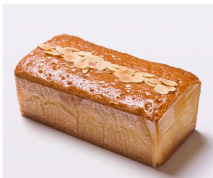
ハンドメイドバターケーキ (大) [アーモンド]