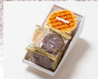
G2-Bセット ¥2,000 (税込 ¥2,160)

サブレ10枚 (バター、ココア各3枚、ココナッツ、黒ごまココア各2枚) ワッフル5枚 (バター3枚、ココア2枚)