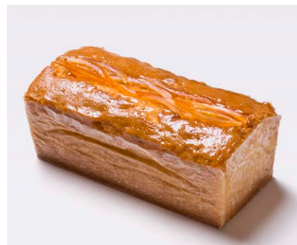
ハンドメイドバターケーキ (大) [オレンジ]