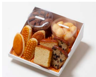
G4-Dセット ¥4,400 (税込 ¥4,752)

ミニバターケーキ4枚 (バター、フルーツ 各2枚) ミルレトン 2個 ユーロンバイ 2個 プチマドレーヌ 2個 (バター、チョコ 各120g入り)