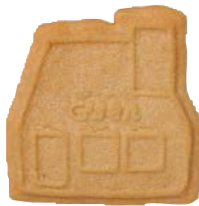
異人館/ココナッツ