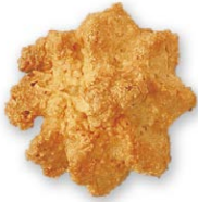
ココナッツ ココナッツの香ばしさを生かした ハードタイプクッキー