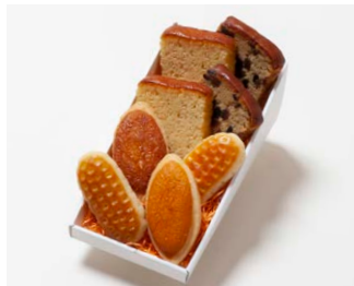
G2-Dセット ¥2,650 (税込 ¥2,862)

ミニバターケーキ4枚 (バター、フルーツ 各2枚) ミルレトン 2個 ユーロンバイ 2個