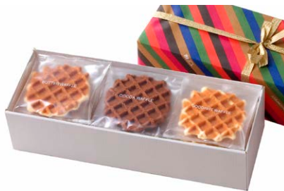
G線職人手焼きワッフル [15枚入り]