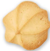
フラワー 素材の良さを充分に生かした スタンダードなおいしさ