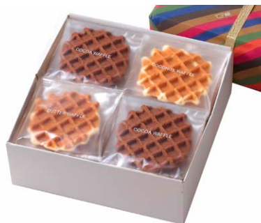
G線職人手焼きワッフル [20枚入り]

バター、ココア、ココナッツ 各5枚 箱サイズ: W310 × H80 × D110mm