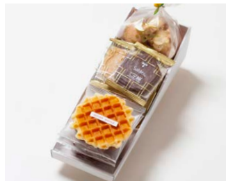
G3-Cセット ¥2,900 (税込 ¥3,132)

サブレ10枚 (バター、ココア各3枚、ココナッツ、黒ごまココア各2枚) ワッフル5枚 (バター3枚、ココア2枚) アソートクッキー 130g