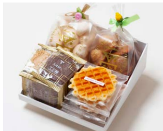
G4-Aセット ¥3,500 (税込 ¥3,780)

サブレ10枚 (バター、ココア各3枚、ココナッツ、黒ごまココア各2枚) ワッフル5枚 (バター3枚、ココア2枚) 天使のメレンゲ 40g エスカルゴバイ 80g