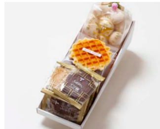
G3-Aセット ¥2,700 (税込 ¥2,916)

サブレ10枚 (バター、ココア各3枚、ココナッツ、黒ごまココア各2枚) ワッフル5枚 (バター3枚、ココア2枚) 天使のメレンゲ 40g