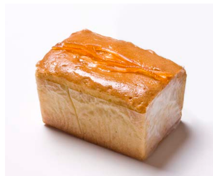
ハンドメイドバターケーキ (小) [オレンジ]