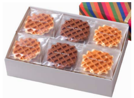
G線職人手焼きワッフル [30枚入り]

バター 5枚、ココア 10枚、ココナッツ 5枚 箱サイズ: W220 × H80 × D220mm