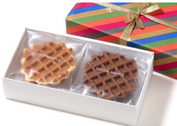
G線職人手焼きワッフル [6枚入り]

バター 2枚、ココア 2枚 箱サイズ: W110 × H75 × D100mm ※熨斗(のし) 対応/不可