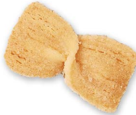
バビヨン かわいい蝶の形に焼き上げた 素朴なパイクッキー