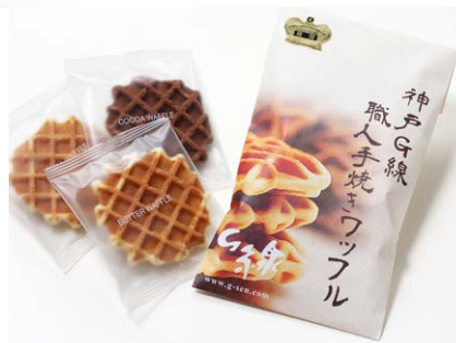
G線職人手焼きワッフル [3枚入り]

バター、ココア、ココナッツ 各1枚 箱サイズ: W107 × H50 × D125mm ※熨斗(のし) 対応/不可