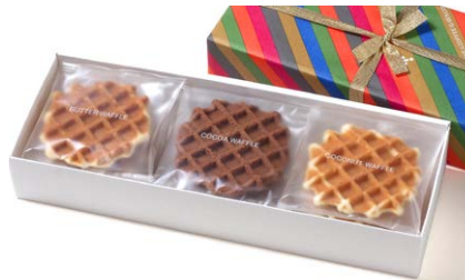
G線職人手焼きワッフル [9枚入り]