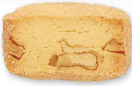
クルミ 香ばしいクルミと生地の食感 があとひくおいしさ