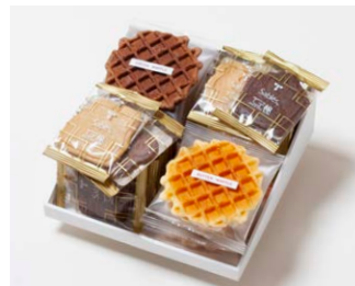
G4-Bセット ¥3,900 (税込 ¥4,212)

サブレ20枚 (バター、ココア各6枚、ココナッツ、黒ごまココア各4枚) ワッフル10枚 (バター6枚、ココア4枚)