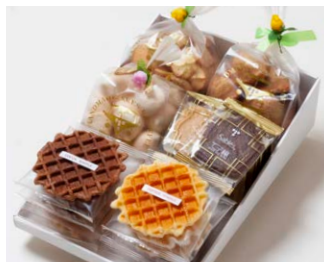
G6-Aセット ¥5,300 (税込 ¥5,724)

サブレ10枚 (バター、ココア各3枚、ココナッツ、黒ごまココア各2枚) ワッフル10枚 (バター6枚、ココア4枚) 天使のメレンゲ 40g アソートクッキー 130g エスカルゴバイ 80g