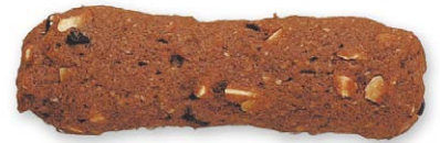
ココアーモンド クラッシュしたアーモンドとカカオを 使用したチョコクッキー