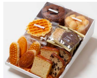
G6-Cセット ¥6,200 (税込 ¥6,696)

サブレ10枚 (バター、ココア各3枚、ココナッツ、黒ごまココア各2枚) ワッフル5枚 (バター3枚、ココア2枚) プチマドレーヌ 2個 (バター、チョコ 各120g入り) ミニバターケーキ4枚 (バター、フルーツ 各2枚) ミルレトン 2個 ユーロンバイ 2個