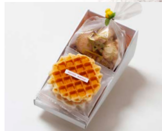
G2-Aセット ¥1,900 (税込 ¥2,052)

箱サイズ: W185 × H45 × D245mm ※熨斗 (のし) 対応/不可