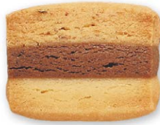
トリコロール ココア生地をバターと ヘーゼルナッツの生地でサンド