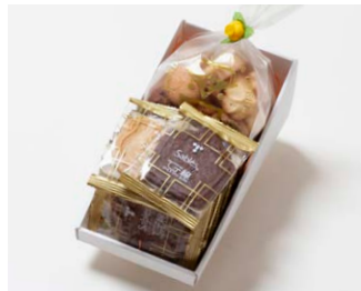
G2-Cセット ¥1,950 (税込 ¥2,106)

サブレ10枚 (バター、ココア各3枚、ココナッツ、黒ごまココア各2枚) アソートクッキー 130g