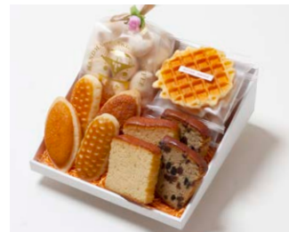
G4-Cセット ¥4,200 (税込 ¥4,536)

ミニバターケーキ4枚 (バター、フルーツ 各2枚) ミルレトン 2個 ユーロンバイ 2個 ワッフル5枚 (バター3枚、ココア2枚) 天使のメレンゲ 40g