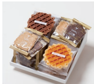
G4-Bセット ¥3,500 (税別) サブレ 20枚(バター、ココア各6枚、ココナッツ、黒ごまココア各4枚) ワッフル 10枚(バター6枚、ココア4枚) 箱サイズ:W215 x H80 x D215mm