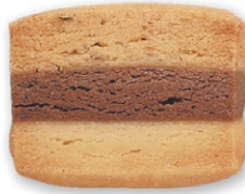
トリコロール ココア生地をバターと ヘーゼルナッツの生地でサンド