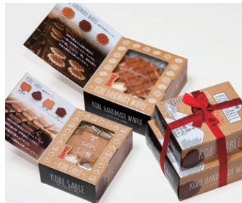
ワッフル&サブレ ¥800 (税別) サブレ 4枚(バター・ココア・ココナッツ・黒ごまココア各1枚) ワッフル 3枚(バター・ココア・ココナッツ各1枚) 箱サイズ:W107 x H95 x D125mm ※熨斗(のし)対応/不可