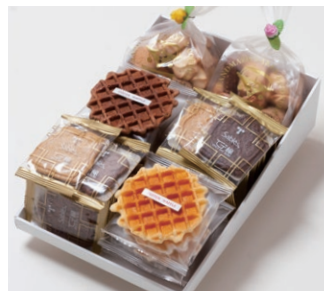
G6-Bセット ¥5,000 (税別) ワッフル 10枚(バター6枚、ココア4枚) サブレ 20枚(バター、ココア各6枚、ココナッツ、黒ごまココア各4枚) アソートクッキー 130g 2個 箱サイズ:W215 x H80 x D315mm