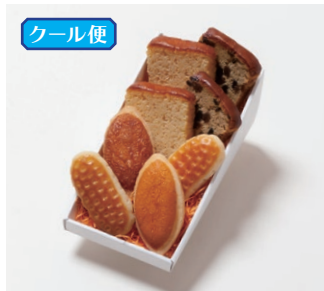
G2-Dセット ¥2,200 (税別) ミニバターケーキ 4枚(バター・フルーツ 各2枚) ミルレトン 2個 ユーロンパイ 2個 箱サイズ:W215 x H80 x D110mm