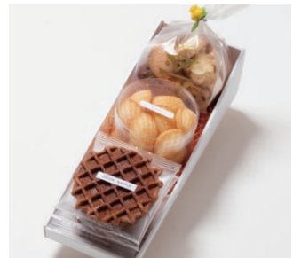
G3-Bセット ¥2,500 (税別) ワッフル 5枚(バター3枚、ココア2枚) プチマドレーヌ(バター) 120g アソートクッキー 130g 箱サイズ:W315 x H80 x D110mm