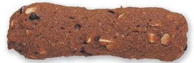
ココアーモンド クラッシュしたアーモンドとカカオを 使用したチョコクッキー