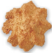
ココナッツ ココナッツの香ばしさを生かした ハードタイプクッキー