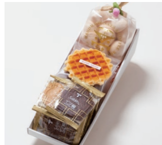
G3-Aセット ¥2,000 (税別) サブレ 8枚(バター、ココア、ココナッツ、黒ごまココア各2枚) ワッフル 4枚(バター2枚、ココア2枚) 天使のメレンゲ 40g 箱サイズ:W315 x H80 x D110mm