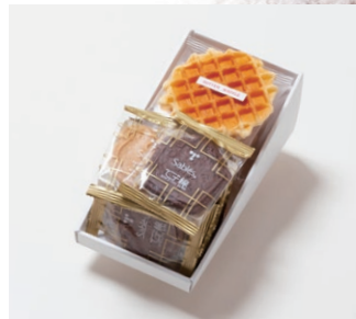
G2-Aセット ¥1,500 (税別) サブレ 9枚(バター、ココア、ココナッツ各3枚) ワッフル 4枚(バター2枚、ココア2枚) 箱サイズ:W215 x H80 x D110mm