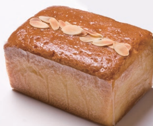
ハンドメイドバターケーキ(小) [アーモンド]