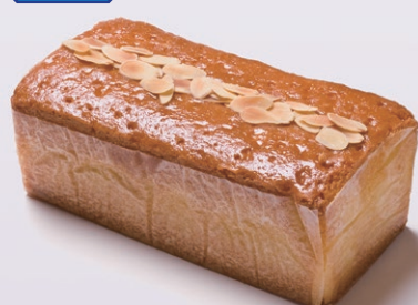
ハンドメイドバターケーキ(大) [アーモンド]