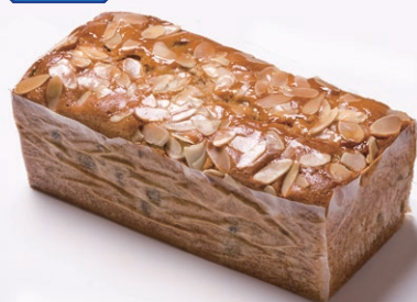
ハンドメイドバターケーキ(大) [フルーツ]