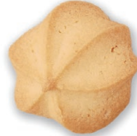
フラワー 素材の良さを充分に生かした スタンダードなおいしさ