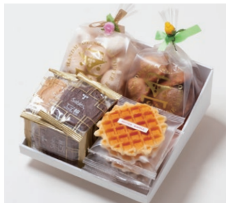
G4-Aセット ¥3,000 (税別) サブレ 10枚(バター、ココア各3枚、ココナッツ、黒ごまココア各2枚) ワッフル 5枚(バター3枚、ココア2枚) 天使のメレンゲ 40g エスカルゴパイ 80g 箱サイズ:W215 x H80 x D215mm