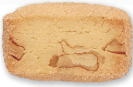
クルミ 香ばしいクルミと生地の食感 があとひくおいしさ