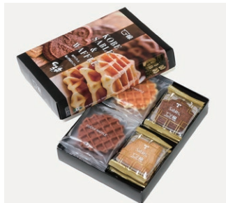
ワッフル&サブレ ¥1,200 (税別) サブレ 6枚(ココナッツ、黒ごまココア各3枚) ワッフル 4枚(バター・ココア・ココナッツ各2枚) 箱サイズ:W185 x H45 x D245mm ※熨斗(のし)対応/不可