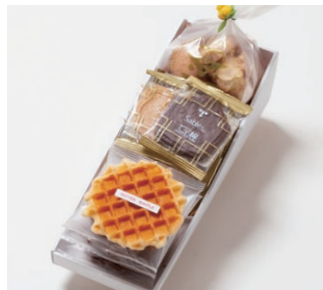
G3-Cセット ¥2,600 (税別) ワッフル 5枚(バター3枚、ココア2枚) サブレ 10枚(バター、ココア各3枚、ココナッツ、黒ごまココア各2枚) アソートクッキー 130g 箱サイズ:W315 x H80 x D110mm