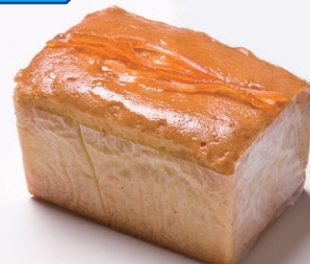
ハンドメイドバターケーキ(小) [オレンジ]