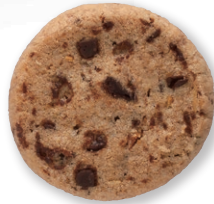
ベネチア スイス産バナラチョコチップを ふんだんに使用した アーモンドクッキーです