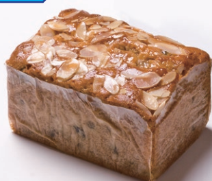
ハンドメイドバターケーキ(小) [フルーツ]