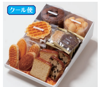
G6-Cセット ¥5,500 (税別) ミニバターケーキ 4枚(バター・フルーツ 各2枚) ミルレトン 2個 ユーロンパイ 2個 ワッフル 5枚(バター3枚、ココア2枚) サブレ 10枚(バター、ココア各3枚、ココナッツ、黒ごまココア各2枚) プチマドレーヌ 2個(バター、チョコ 各120g入り) 箱サイズ:W215 x H80 x D315mm