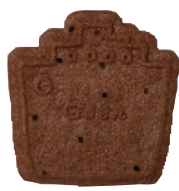
船/黒ごま・ココア