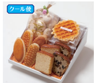
G4-Cセット ¥3,600 (税別) ミニバターケーキ 4枚(バター・フルーツ 各2枚) ミルレトン 2個 ユーロンパイ 2個 ワッフル 5枚(バター3枚、ココア2枚) 天使のメレンゲ 40g 箱サイズ:W215 x H80 x D215mm