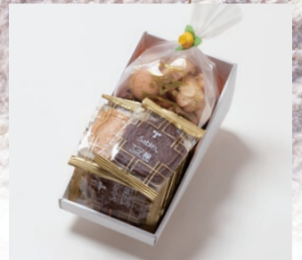
G2-Bセット ¥1,500 (税別) サブレ 8枚(バター、ココア、ココナッツ、黒ごまココア各2枚) アソートクッキー 130g 箱サイズ:W215 x H80 x D110mm