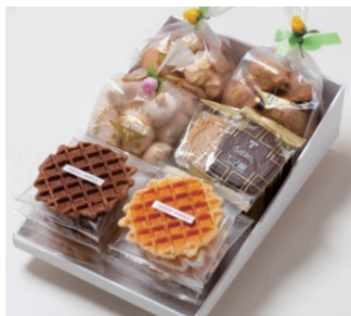
G6-Aセット ¥4,800 (税別) ワッフル 10枚(バター6枚、ココア4枚) サブレ 10枚(バター、ココア各3枚、ココナッツ、黒ごまココア各2枚) 天使のメレンゲ 40g アソートクッキー 130g エスカルゴパイ 80g 箱サイズ:W215 x H80 x D315mm