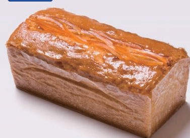
ハンドメイドバターケーキ(大) [オレンジ]