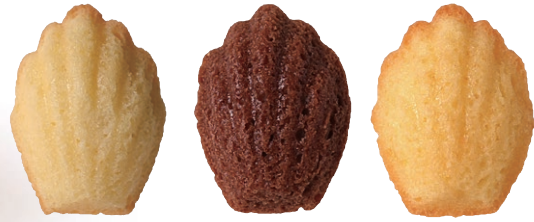
バター チョコレート オレンジ