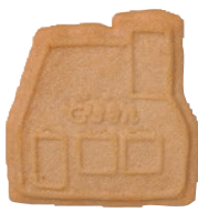
異人館/ココナッツ