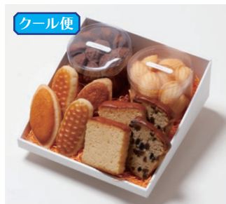
G4-Dセット ¥3,800 (税別) ミニバターケーキ 4枚(バター・フルーツ 各2枚) ミルレトン 2個 ユーロンパイ 2個 プチマドレーヌ 2個(バター、チョコ 各120g入り) 箱サイズ:W215 x H80 x D215mm