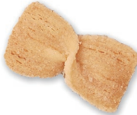
バビヨン かわいい蝶の形に焼き上げた 素朴なパイクッキー