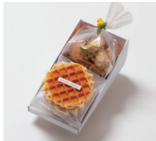
G2-Cセット ¥1,500 (税別) ワッフル 4枚(バター2枚、ココア2枚) アソートクッキー 130g 箱サイズ:W215 x H80 x D110mm